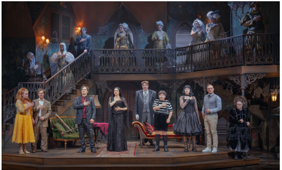
The Addams Family -musikaali yhdistää tumman huumorin, vauhdikkaan musiikin, näyttävät tanssinumerot, upean puvustuksen ja lavasteet sekä näyttelijöiden ihaltavat roolisuoritukset.