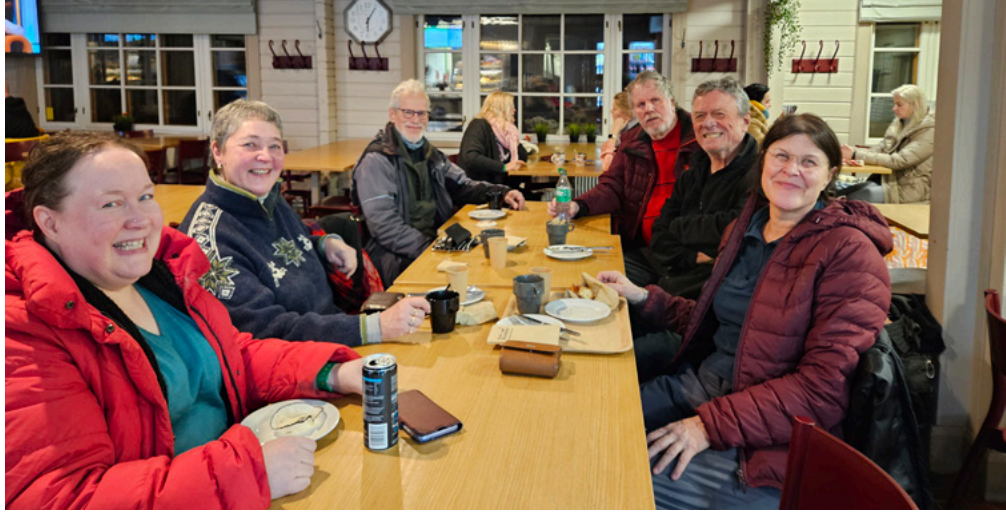
Saunomisen ja uinnin jälkeen koko porukka kerääntyi piirakkakaakaoille Kuusijärven kahvilaan jutustelemaan.