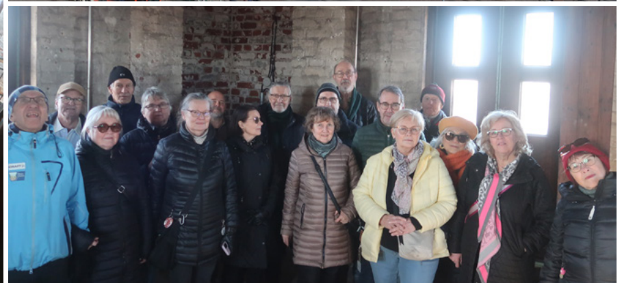
Parisenkymmentä senioria kipusi maaliskuussa ihastelemaan Helsingin päärautatieaseman kellotornista avautuvia upeita näkymiä Helsingin historialliseen keskustaan.