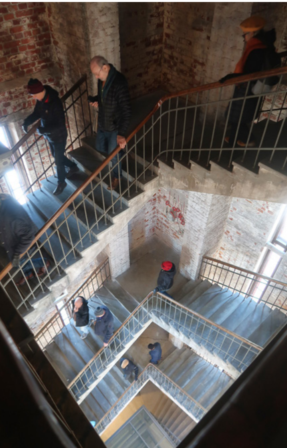
Kellotornin korkeus kadun pinnasta mitattuna on 49,6 metriä.

Teksti ja kuvat: Maija-Liisa Kolehmainen