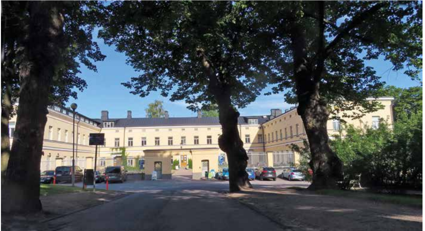
Mielenkiinto Lapinlahden alueen rakentamisesta tai rakentamattomuudesta jatkuu.

loksena oli tämä koko Euroopankin ensimmäisiin lukeutuva, alun perin mielisairaanhoidon suunniteltu rakennus.