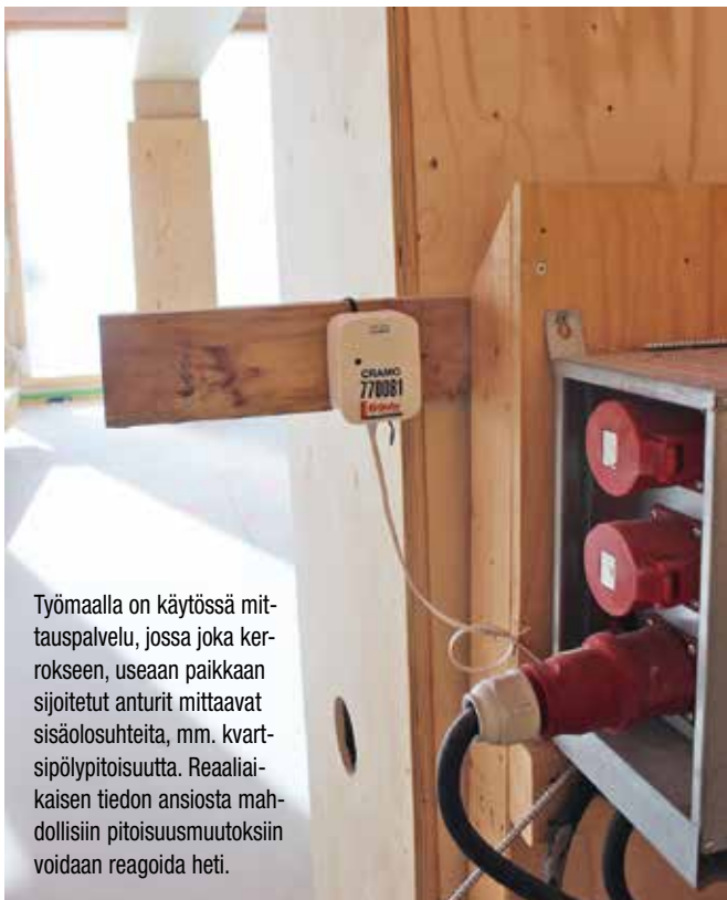
Työmaalla on käytössä mittauspalvelu, jossa joka kerrokseen, useaan paikkaan sijoitetut anturit mittaavat sisäolosuhteita, mm. kvartsipölypitoisuutta. Reaaliaikaisen tiedon ansiosta mahdollisiin pitoisuusmuutoksiin voidaan reagoida heti.

Myös rakennusmateriaaleilla on merkitystä. Esimerkiksi tasoitteet ovat Koskisen mukaan kehittyneet huomattavasti pölyttömimmiksi. Myös valmiiden tasoitesäkkien käyttö on pölyttömämpää kuin sekoittaminen työmaalla.