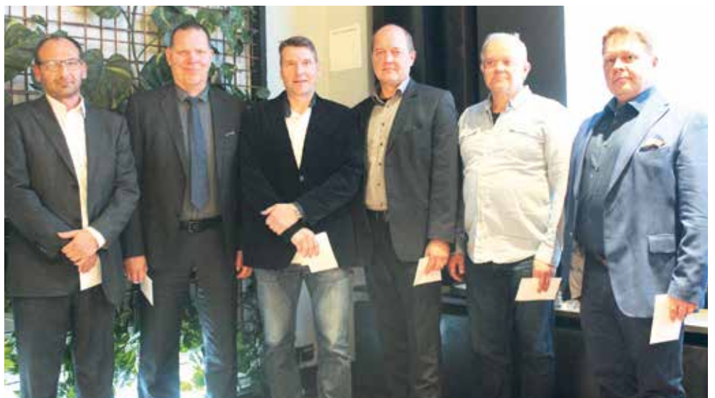
RKL:n 25-vuotismerkkin saajista oli Syyskokouksessa paikalla kuusi.