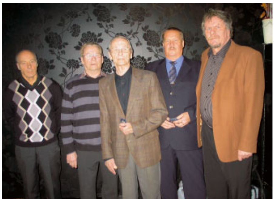
Yhdistyksen uintimestaruuskisoihin osallistuneet saivat mitalit.