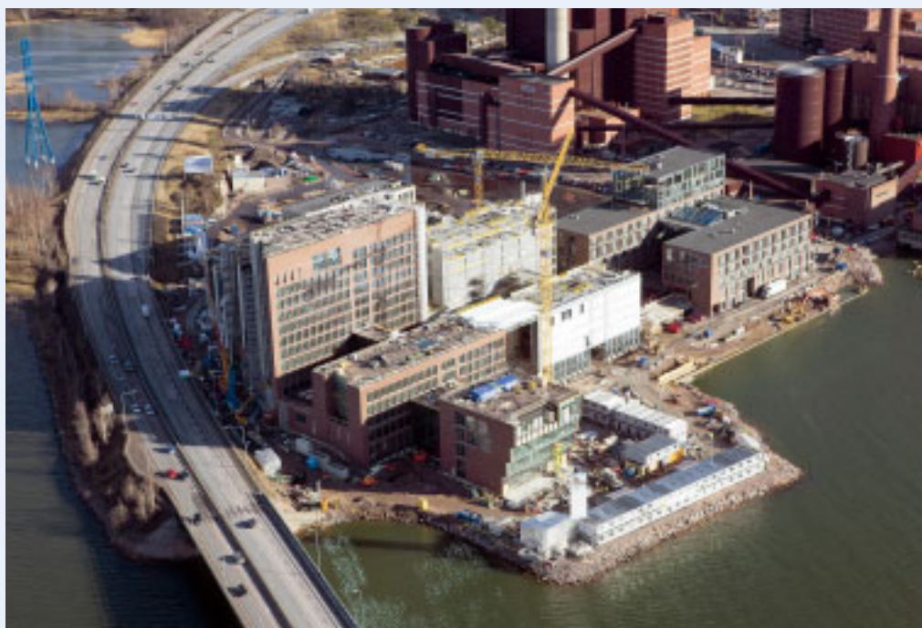
Työmaa vuosi sitten helmikuussa 2008. Kahdeksasta rakennuksesta muodostuvan kohteen sijainti niemen kärjessä vain yhden kulkuväylän ruokkimana on ollut työmaalle iso haaste.

Rakentaminen alkoi kesällä 2006. Perustusvaihe osoittautui aikataulullisesti vaativaksi, sillä viivettä tuli liki kolme kuukautta. Syynä